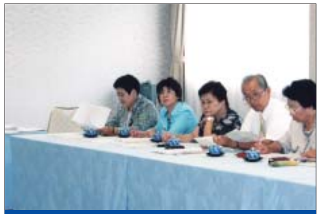
8月19日 花巻温泉 ホテル千秋閣

民主党の男女共同参画の取り組みをより強化するために2005年12月に「男女共同参画推進本部」が設置されました。本部と連携して政策と運動を結びつけ様々な活動を展開していこうとするものです。岩手県の東北大会において今回初めて本格的な会議が開催されました。わが国は世界の先進国に比べてまだまだ男女共同参画社会といえない状況にあります。この会議には是非たくさんの男性議員に参加していただき、男性も女性も自分らしく生きていくための社会の確立をより一層進めていきたいと思っております。